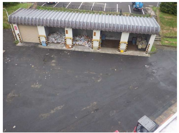
雑誌・新聞紙ストックヤード前 (屋上から撮影)