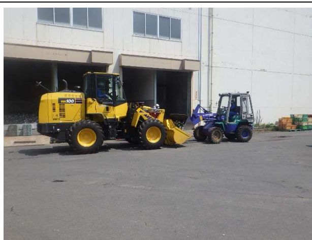
積み込み作業状況