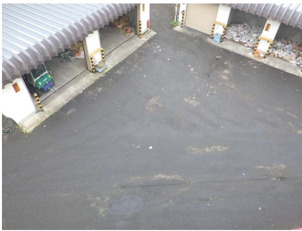
雑紙・段ボールストックヤード前 (屋上から撮影)