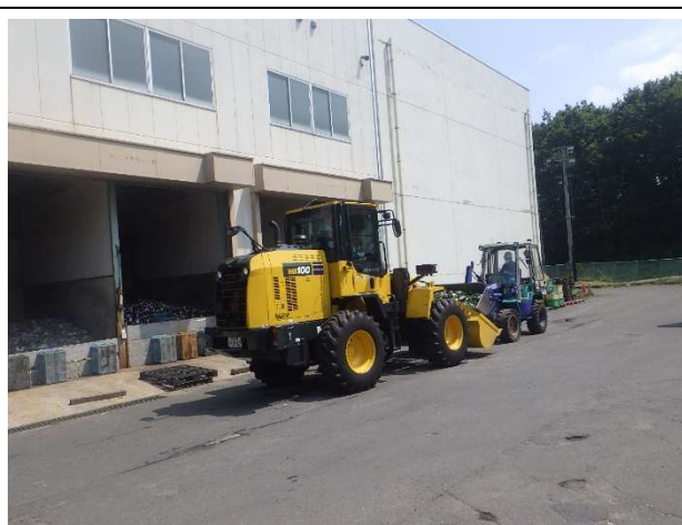
積み込み作業状況