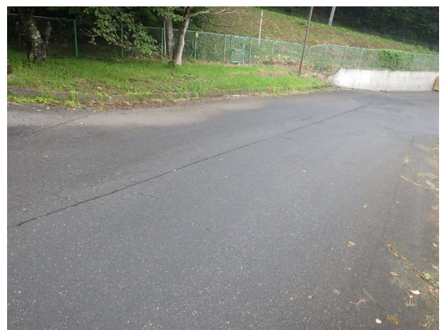
粗大ごみ処理施設 搬入路入口