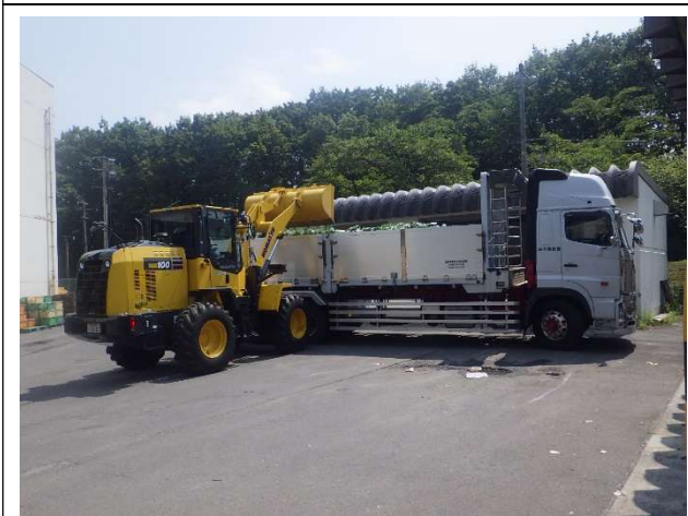
積み込み作業状況