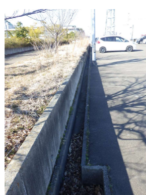
N U型側溝 W240