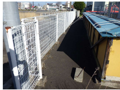
E メッシュフェンス H1.2m