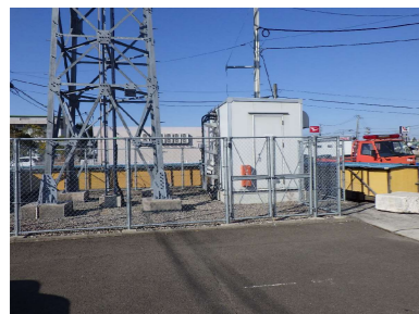
F メッシュフェンス H1.8m