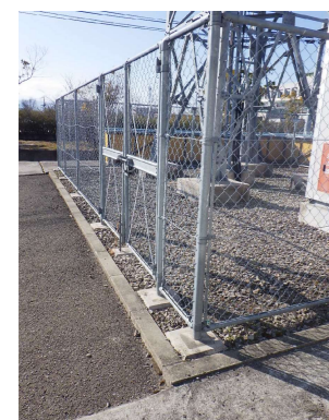
F メッシュフェンス H1.8m L 地先境界ブロック