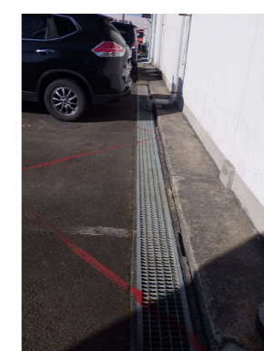
O U型側溝 W300