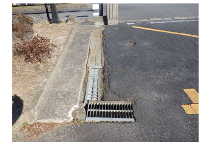
M U型側溝 W150