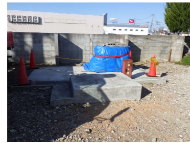
④ 北西部危険物倉庫基礎