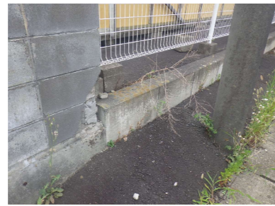
K 歩車道境界ブロック W180 Cタイプ