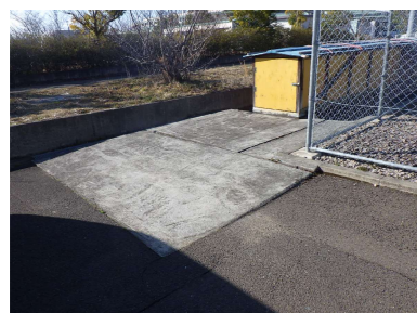
R コンクリート土間