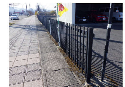
D 縦格子フェンス H0.9m