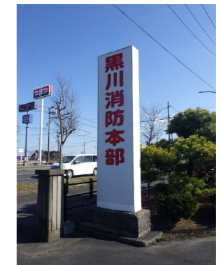
X 自立看板及び基礎