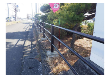
B 歩道用ガードパイプ H0.85m I 歩車道境界ブロック W50 Aタイプ