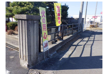
A 歩道用ガードパイプ G 門柱