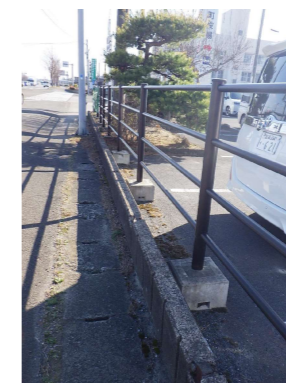
C 歩道用ガードパイプ H1.1m H L型土留め