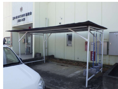
⑥ 自転車置き場基礎土間