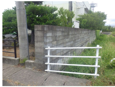
P CB塀 基礎は残す