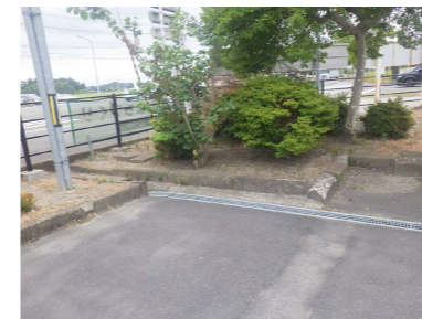
J 歩車道境界ブロック W80 Bタイプ