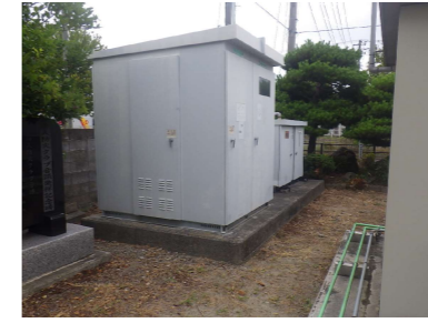
T キュービクル U 自家発電機