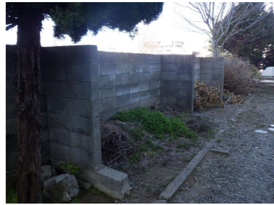
P CB塀 基礎は残す P 同上控え壁 基礎は残す