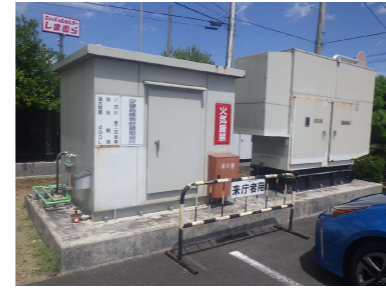
⑤ 少量危険物倉庫 V 自家発電機