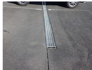
M L型側溝 W50