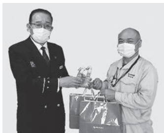
仙台小林製薬株式会社 様より